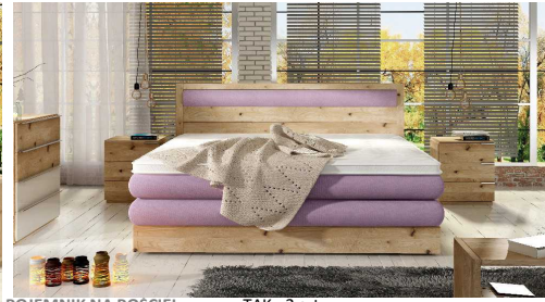
POJEMNIK NA POŚCIEL WYMIAR POJEMNIKA

TAK - 2 szt. A= 17x65x195 cm, B= 17x75x194 cm C= 17x85x194 cm