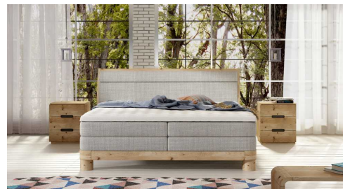
POJEMNIK NA POŚCIEL NIE